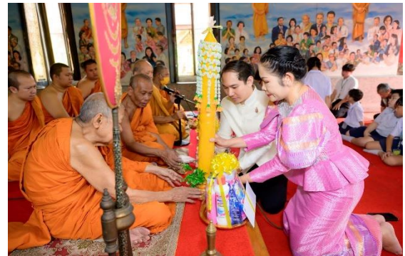
ร่วมกิจกรรมวันสำคัญทางศาสนา