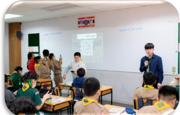
Amarin News ข่าวประชาสัมพันธ์โรงเรียน