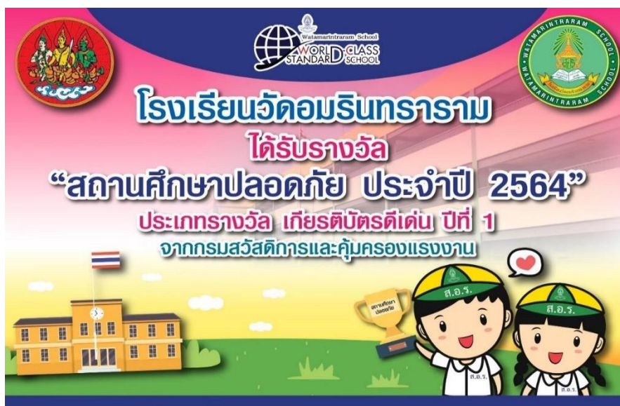
รางวัล “สถานศึกษาปลอดภัย ประจำปี 2564” รางวัล เกียรติบัตรดีเด่น ปีที่ 1