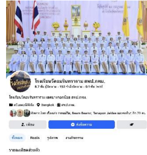
เฟซบุ๊กโรงเรียนวัดอมรินทร์าราม