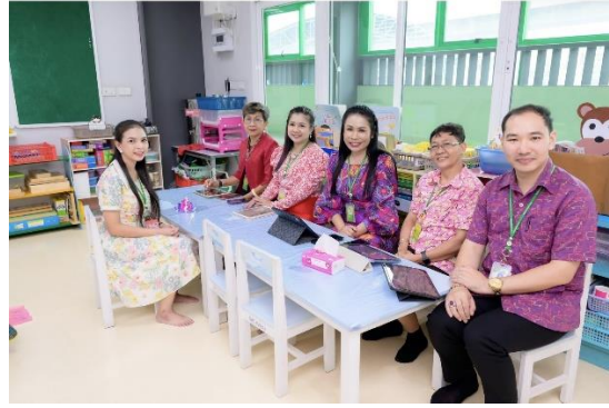
โครงการนิเทศภายใน