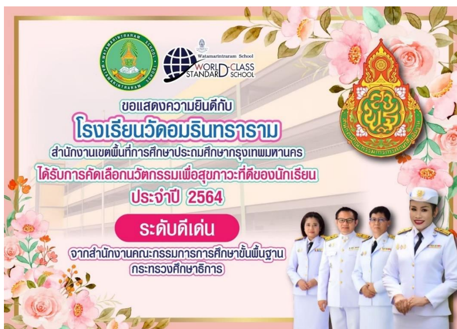
ได้รับการคัดเลือกนวัตกรรมเพื่อสุขภาวะที่ดีของนักเรียนประจำปี 2564 ระดับดีเด่น