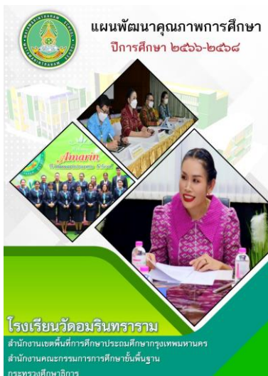
แผนพัฒนาคุณภาพการศึกษา

นอกจากนี้ โรงเรียนยังให้ความสำคัญกับการสร้างเครือข่ายความร่วมมือกับหน่วยงานและองค์กรที่เกี่ยวข้อง เพื่อร่วมกันขับเคลื่อนการจัดการศึกษาให้บรรลุเป้าหมายที่กำหนดไว้ การดำเนินงานดังกล่าวสะท้อนถึงความรับผิดชอบต่อสังคมของสถานศึกษาในการเปิดเผยข้อมูลอย่างโปร่งใส มีส่วนร่วม และตอบสนองต่อความต้องการของชุมชนและสังคมได้อย่างเหมาะสมและมีประสิทธิภาพ