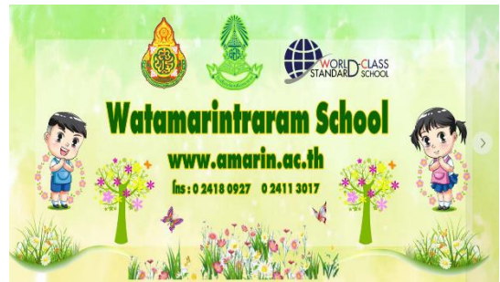
เฟซบุ๊ก MEP โรงเรียนวัดอมรินทร์าราม