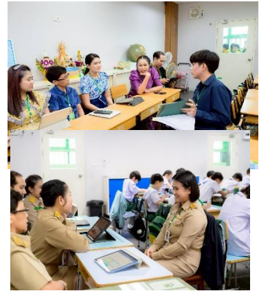
การใช้สื่อเทคโนโลยีที่ทันสมัยในการจัดการเรียนการสอน เช่น IPAD Projector และจัดทำสื่อจาก Application