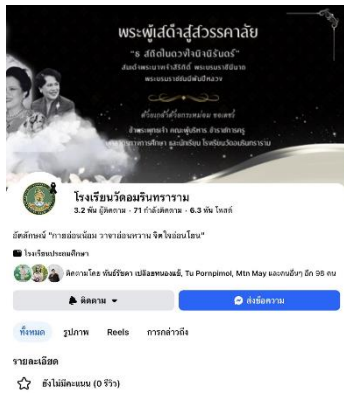
เพจโรงเรียนวัดอมรินทร์าราม