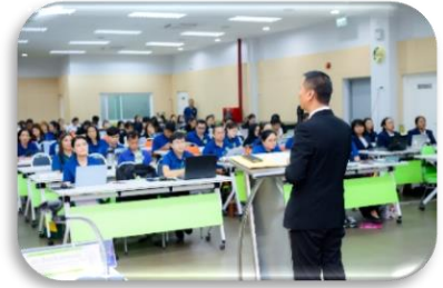
การนิเทศติดตามการจัดการเรียนการสอนอย่างกัลยาณมิตร