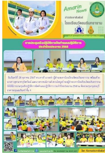
ประชุมจัดทำแผนปฏิบัติการ