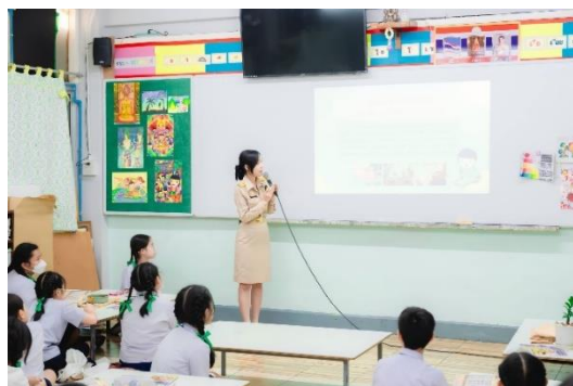
การเรียนการสอนห้องปฏิบัติการศิลปะ