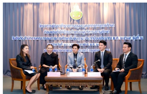
ผู้บริหารมีความเป็นผู้นำทางวิชาการ