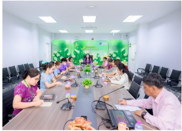
ประชุม แลกเปลี่ยนเรียนรู้