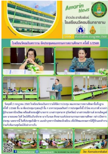
ประชุมคณะกรรมการสถานศึกษา