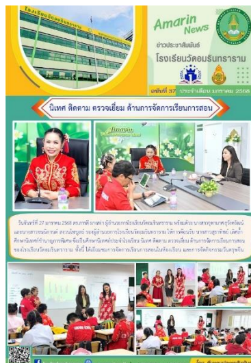
นิเทศติดตามการจัดการเรียนรู้