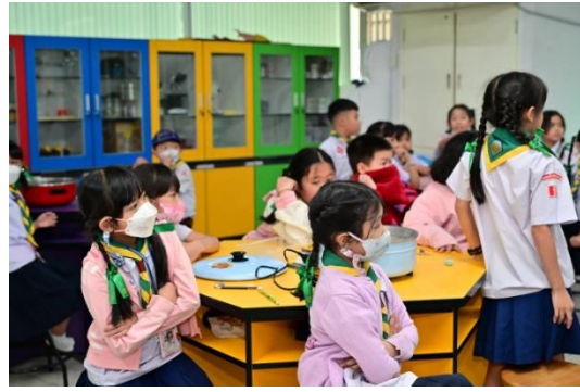
การเรียนการสอนห้องปฏิบัติการวิทยาศาสตร์