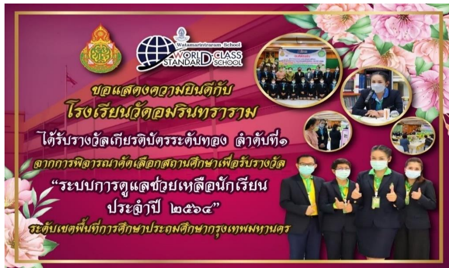
เกียรติบัตรระดับทอง ลำดับที่ 1 “ระบบการดูแลช่วยเหลือนักเรียน”