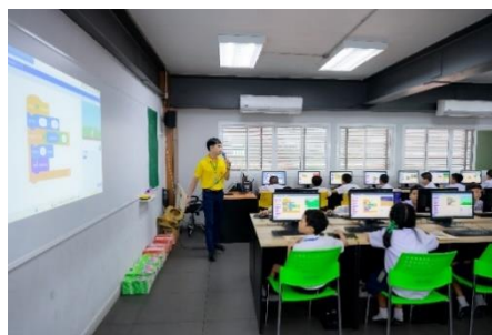
ภาพประกอบการใช้คอมพิวเตอร์ แท็บเล็ตของนักเรียนในการจัดการเรียนการสอนวิชาวิทยาศาสตร์