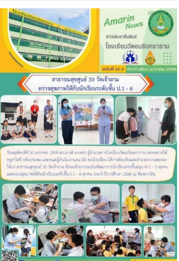
ประสานความร่วมมือกับสาธารณสุขสูง 30