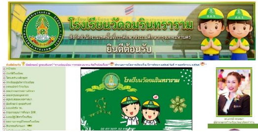
เว็บไซต์โรงเรียนวัดอมรินทร์าราม