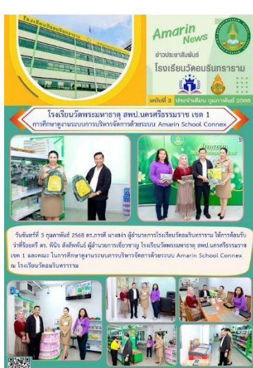
โรงเรียนวัดพระมหาธาตุ สสป. นครศรีธรรมราช เขต ๑ ศึกษาดูงาน