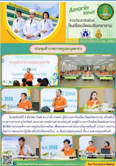
ประชุมข้าราชการครู และบุคลากรทางการศึกษา