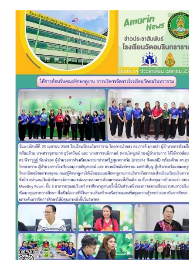
ศึกษาดูงาน การบริหารจัดการสถานศึกษา