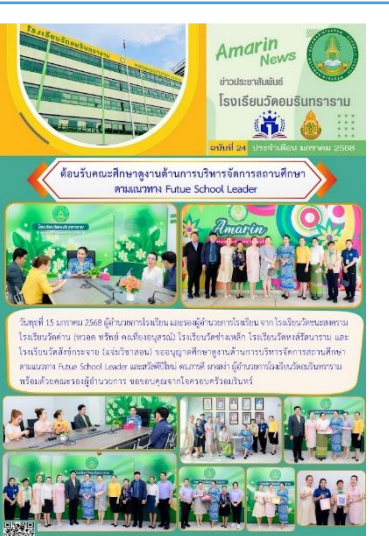
ศึกษาดูงานด้านบริหารจัดการสถานศึกษา