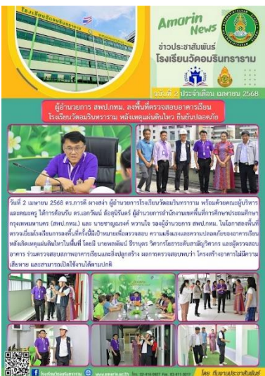
ผอ.สสป.ภทท. นิเทศ ติดตาม ตรวจสอบ เยี่ยม โรงเรียน