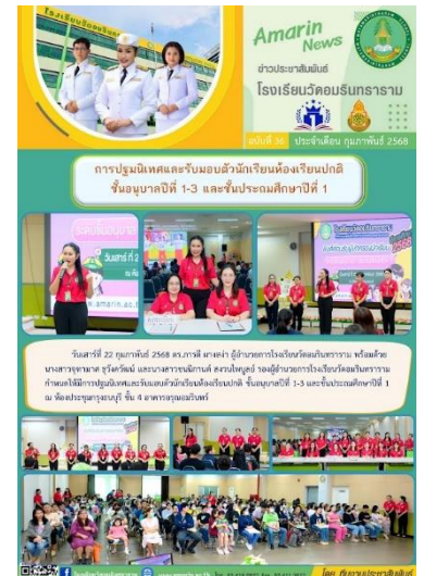
ประชุมนิเทศผู้ปกครองนักเรียนห้องเรียนปกติ