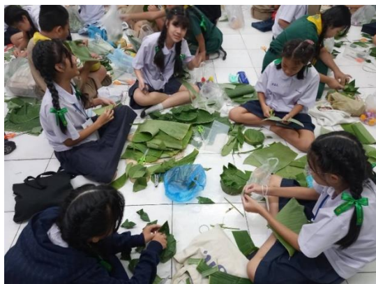
การเรียนการสอนห้องปฏิบัติการการงานอาชีพ