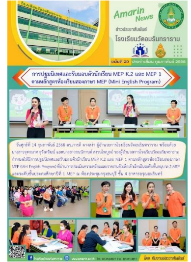
ประชุมผู้ปกครองนักเรียนห้องเรียน MEP