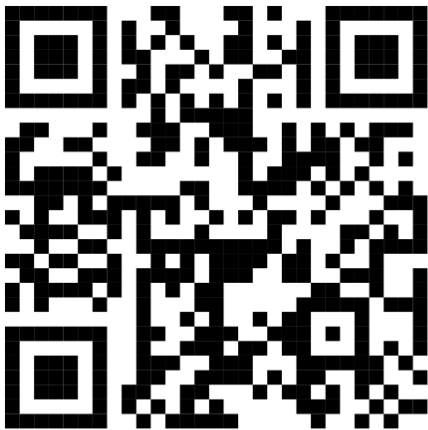
ภาคผนวก ก ประกาศโรงเรียนวัดอมรินทราราม