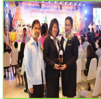
รับรางวัล OBECQA